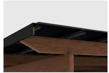
Faîtage (capotage des rails en option)